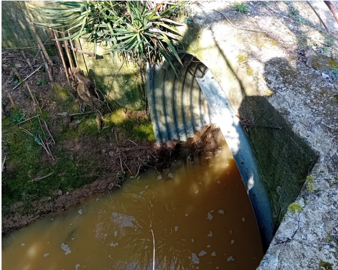
Rio nero – Attraversamento 2 – tratto di valle