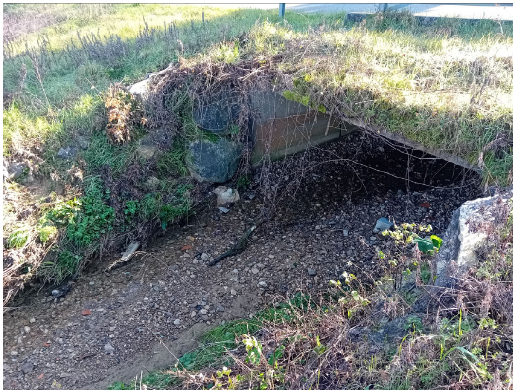
Rio Dolcione – Attraversamento 13 – vista tratto di valle