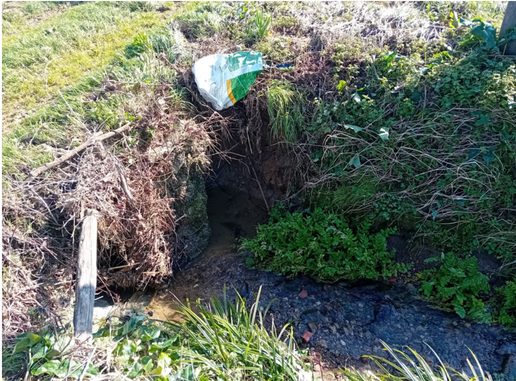
Rio Guadagnino – Attraversamento 7.5 – tratto di vale