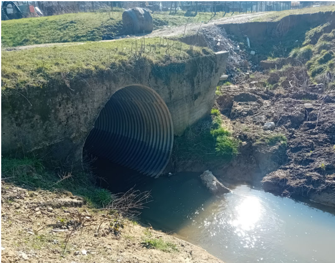
Rio nero – Attraversamento 1 – tratto di valle