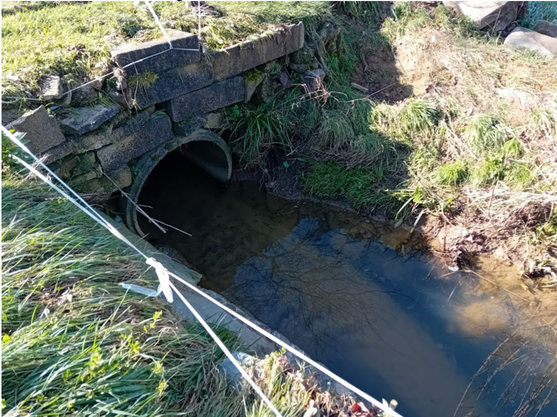
Rio Guadagnino – Attraversamento 8 – tratto di valle