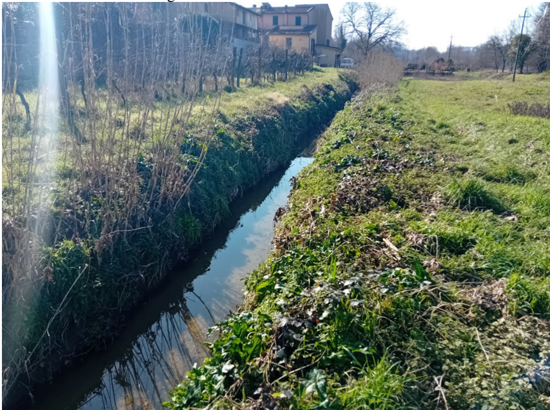
Rio Guadagnino – Attraversamento 9 – vista da monte – Ø 100 cm