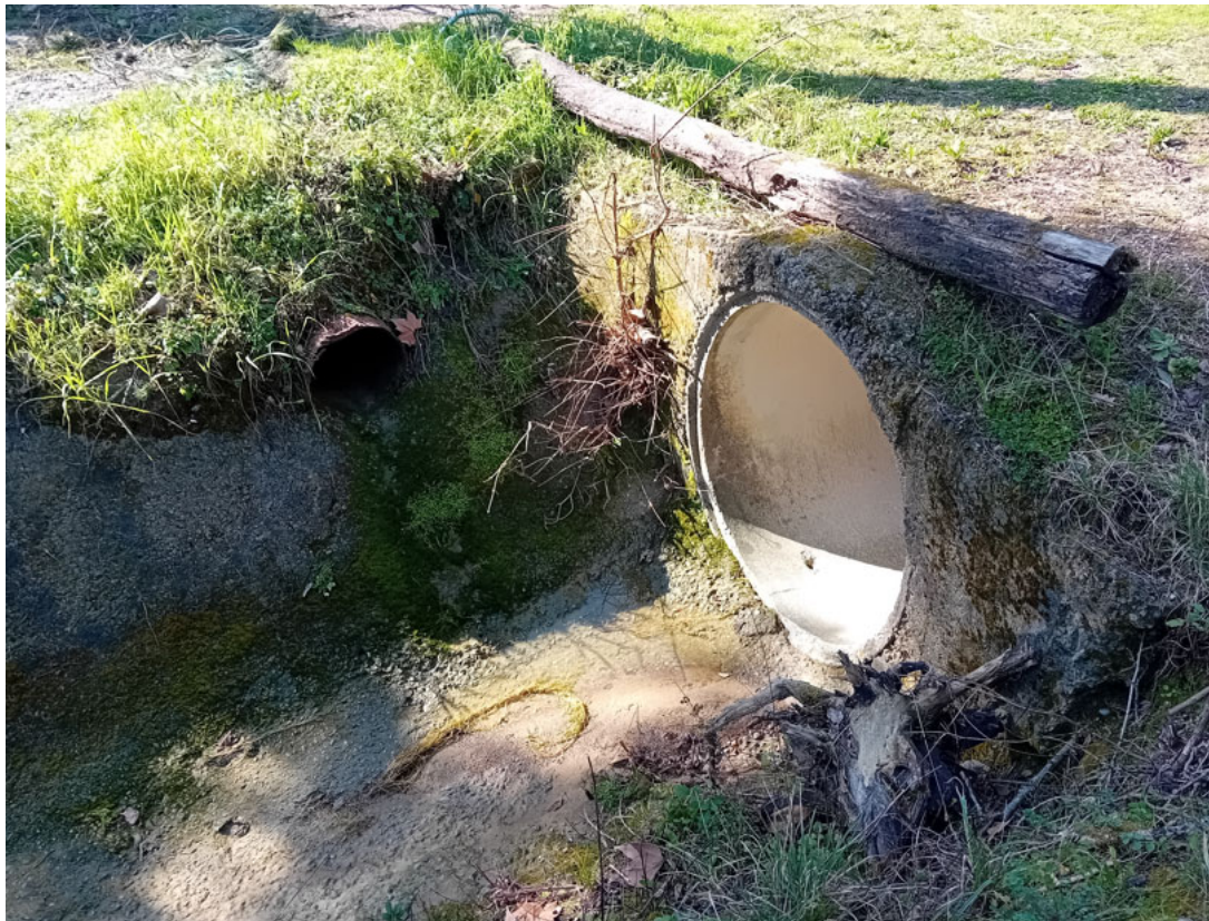
Rio della Selva – Attraversamento 3 – vista da valle – Ø 1200