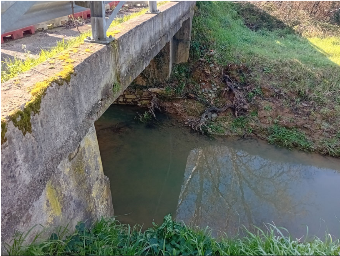
Rio Bottaccio – Attraversamento 12 – tratto di valle