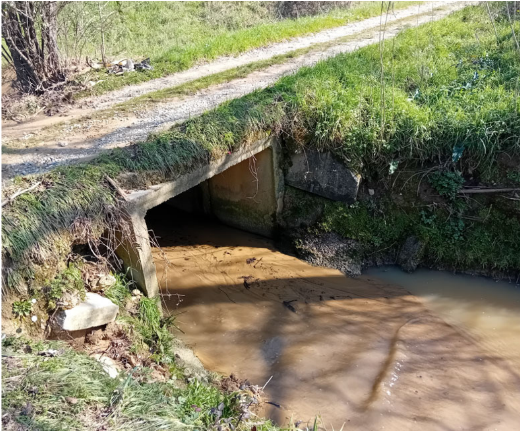
Rio nero – Attraversamento 6 – tratto di valle